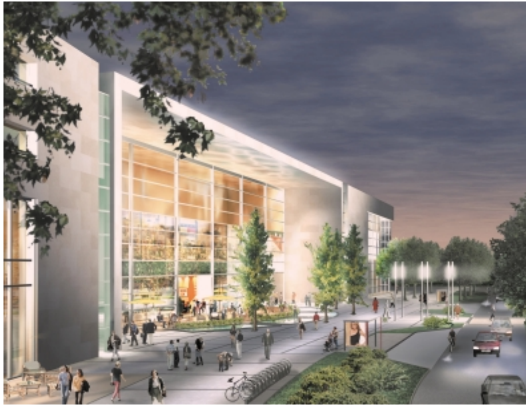
Das Alstertal-Einkaufszentrum wird um 17.000 Quadratmeter erweitert und das gesamte Umfeld mit attraktiven Plätzen aufgewertet. Für die Fassade hat der Lichtkünstler Michael Batz ein Beleuchtungskonzept entwickelt.

Rund um die ECE-Zentrale in Hamburg-Poppenbüttel starten schon bald umfangreiche Bauarbeiten. Bis Herbst 2007 wird das Alstertal-Einkaufszentrum (AEZ) um rund ein Drittel auf dann 59.000 Quadratmeter Verkaufsfläche erweitert und der Branchenmix neu strukturiert. Das Bauvorhaben mit einem Investitionsvolumen von rund 125 Millionen Euro bedeutet weit mehr als die Revitalisierung