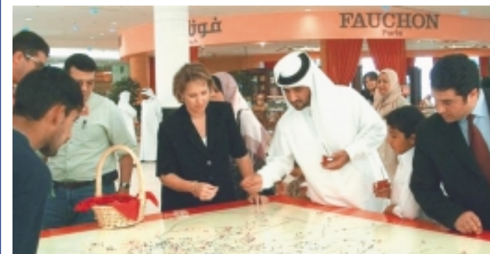
Im City Center Doha, der größten Einkaufsgalerie im Mittleren Osten, trifft sich ein internationales Publikum.

Seit März 2004 ist die ECE auch in der Wachstumsregion am Persischen Golf präsent. Unsere Centermanager leiten die größte Einkaufsgalerie des Mittleren Ostens: das City Center in Doha, der Hauptstadt von Katar. Das Shopping-Center ist mit rund 100.000 Qua-