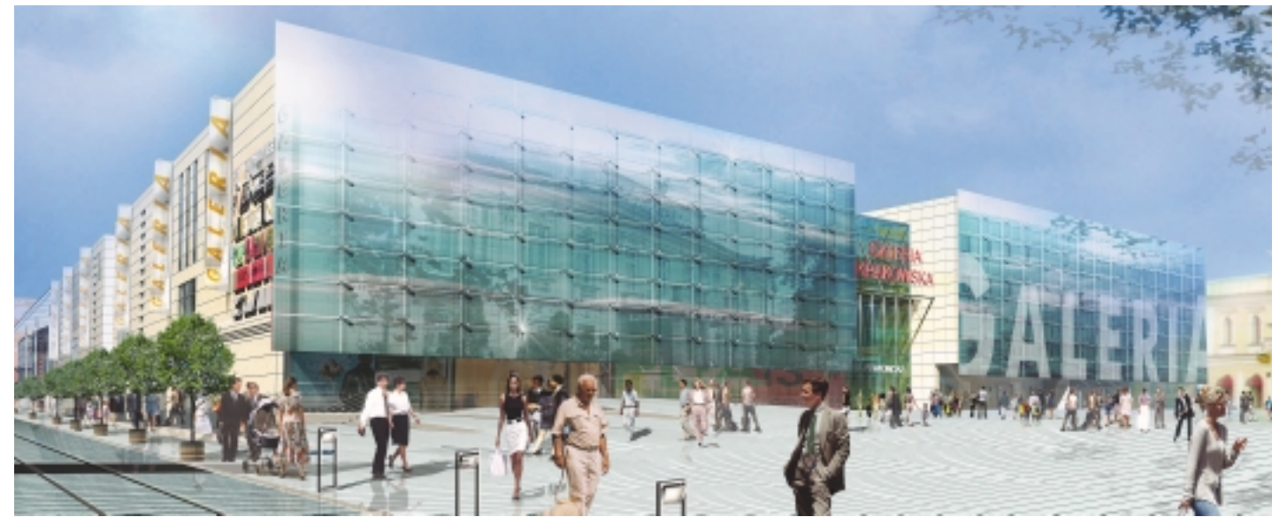
Mit der Galeria Krakowska baut die ECE eine der schönsten und größten Einkaufsgalerien in Mitteleuropa. Die Galerie entsteht am Verkehrsknotenpunkt der Stadt und ist eingebettet in ein multifunktionales Dienstleistungs- und Freizeitzentrum mit Büros, Hotels, Kinosälen sowie internationaler Gastronomie.

In Krakau verwirklicht die ECE eines der größten zukunftsweisenden Projekte in Polen. Zusammen mit Tishman Speyer Properties baut die ECE ein multifunktionales Dienstleistungszentrum direkt neben dem Krakauer Hauptbahnhof und gegenüber der zum Weltkulturerbe gehörenden Altstadt. Rund 250 Millionen Euro werden in